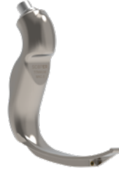
MAC- 3 Yetişkin Blejd