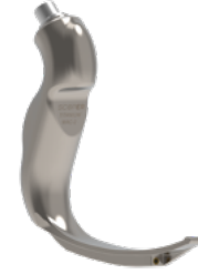
MAC- 2 Çocuk Blejd