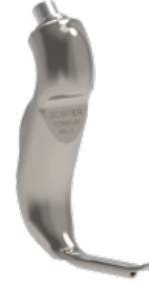
MIL- 0 Yenidoğan Blejd