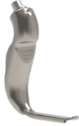
MIL-1 Küçük Çocuk Blejd