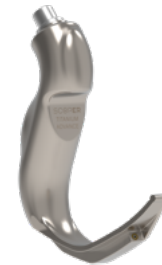
Advance Pediatrik Blejd