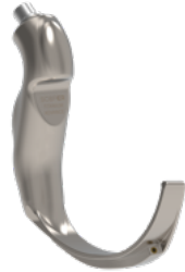
Advance Yetişkin Blejd