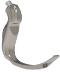
MAC- 4 Yetişkin Blejd